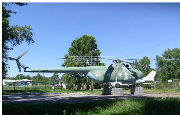
Вертолет МИ-4. Установлен в конце 1980 г. до 1990 году