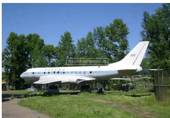
Самолет ТУ-124. Установлен до 1985 году

№ 3. Образец техники – самолет ПЕ-2, пикирующий бомбардировщик, выпускался на Иркутском авиационном заводе.